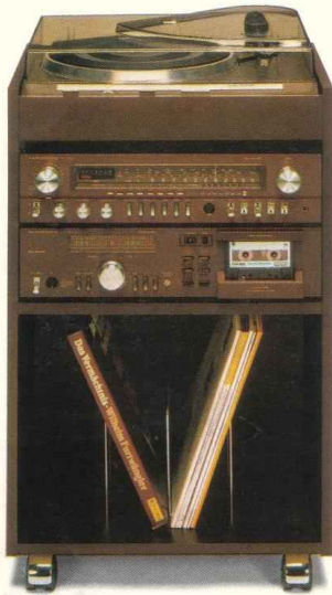
HiFi-Compact-System CS 200-3