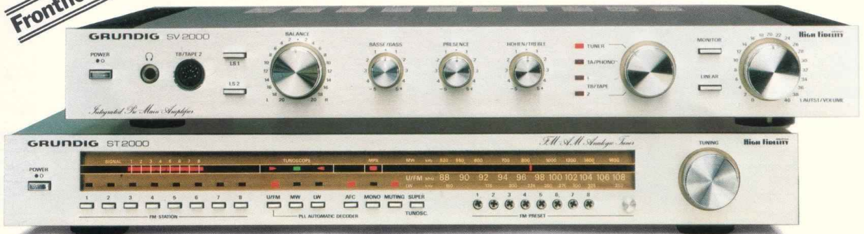
HiFi-Tuner ST 2000