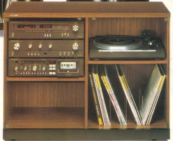
HiFi-Compact-System CS 700-3