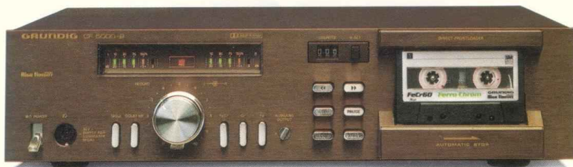
HiFi-Cassetdeck CF 5000-2

Gehäuse: metallfinish-braun Maße: ca. 45 \times 11 \times 38 cm.