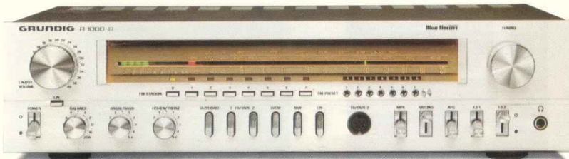
HiFi-Receiver R 1000-2

Messen Sie diese HiFi-Komponenten an ihren testbewährten Vorgängern. Und am Preis.