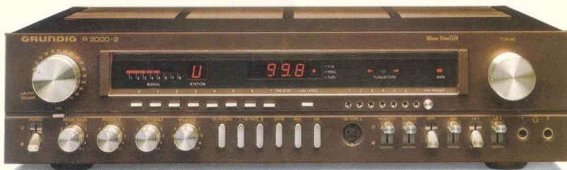
HiFi-Receiver R 3000-2

Gehäuse: metallfinish ab 7/81 und metallfinish-braun ab 4/81. Maße: ca. 45 \times 11 \times 38 cm.